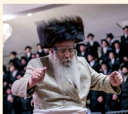
כ"ק האדמו"ר מדינוב הרב יצחק דב רבינוביץ שליט"א

אין ספק שזו הייתה חוויה שאקח עמי עוד זמן רב בעזרת השם.