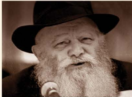
כ"ק האדמו"ר מליובאוויטש זצ"ל בקריאה לילדים בשנת תש"מ לבוא ולשמע את קריאת עשרת הדברות בחג השבועות באזניו את עשרת הדברות.

אחרי התפלה סעד ה"סבא קדישא" בביתו של החוכר היהודי את הסעודה החלבית של חג השבועות. בין מאכל אחד למשנהו אמר הצדיק לחסידיו שאותות של התרגשות עדיין נכרו על פניהם: "את עשרת הדברות האלה ששמעו היום יזכרו הפריצים כל ימי חייהם ולא יציקו לכם יותר. לשם כך נאלצתי להטריח לכאן את משה רבנו בכבודו ובעצמו והוא שקרא בתורה אך כדאי היה הדבר ודעו לכם כי גם הפריץ שלכם אינו גוי ככל הגוים יש בו ניצוץ מנשמתו של יתרו כהן מדין שבא אל בני ישראל למדבר והורה בקיומו של הקדוש ברוך הוא ובעמו הנבחר ישראל". במוצאי חג השבועות שלח הפריץ שליחים אל ביתו של החוכר ובקש מהצדיק לבוא אליו. הצדיק נאות ללכת, הלך אלא ביתו של הגוי המשך בעמוד אחרון